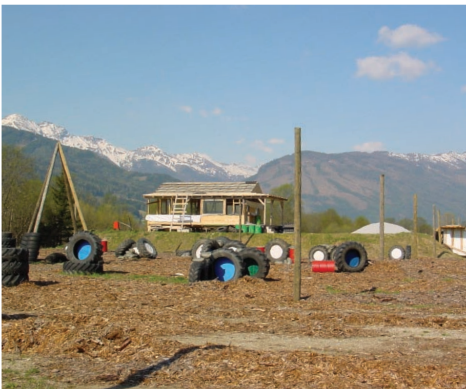
2 Paintball-Anlage im April 2007