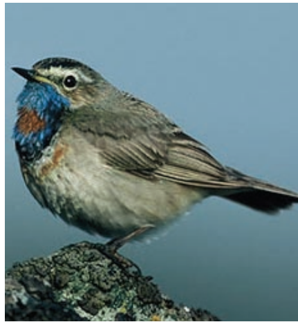
Rotsterniges Blaukehlchen

binden. Andere, ebenfalls absolut geschützte, von der LUA ins Treffen geführte Vogelarten bleiben darin aber weiterhin unberücksichtigt.