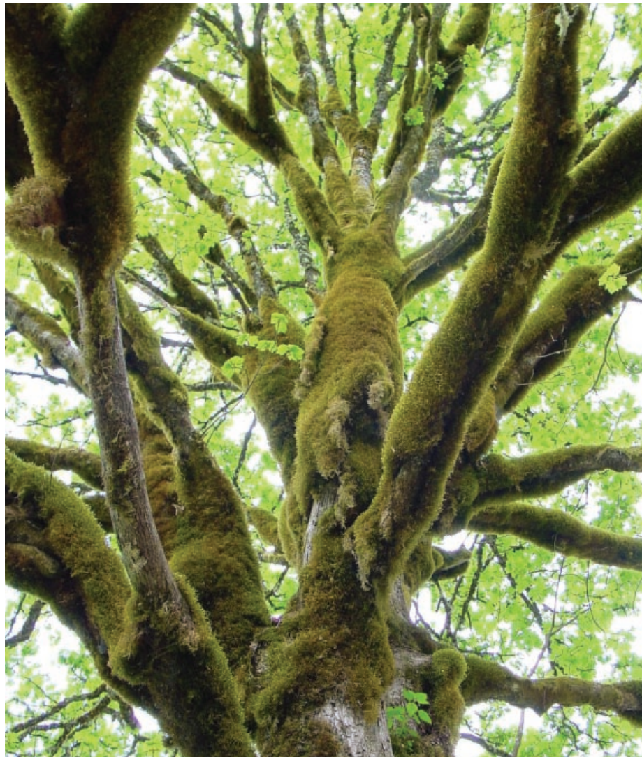
Bergahorn – Einzigartigkeit ist nicht ausgleichbar

Die nächste Naturschutzgesetznovelle brachte nicht nur Anpassungen