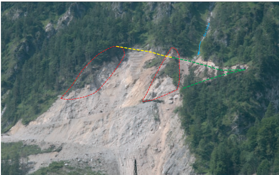
Illegaler Abbau – Folge: Betriebssperre!

Die einzige Sprache die verstanden wird?