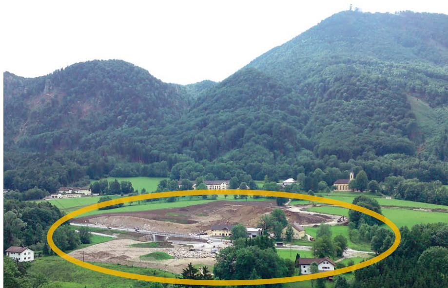
Guggenthal - kostbares Kleinod und zerstörerische Landschaftswunde am Fuße des Gaisberges. Wann wird dieser höchstwertige Raum endlich geschützt?