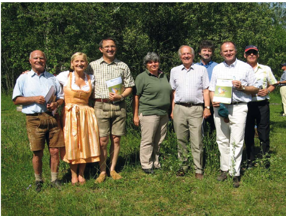
Zahlreiche Prominente gratulierten der Biotopschutzgruppe Pinzgau zum 20jährigen Bestehen