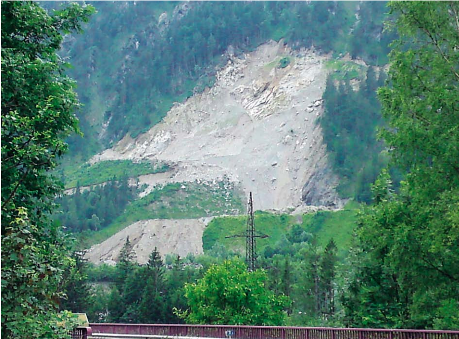
Aus einer kleinen Erweiterung wurde ein Desaster - der Schotterabbau in der Sulzau-Eisgraben wurde über die Abbaugrenzen hinaus betrieben und musste erst kürzlich wegen weiterer Rutschungen erneut eingestellt werden.